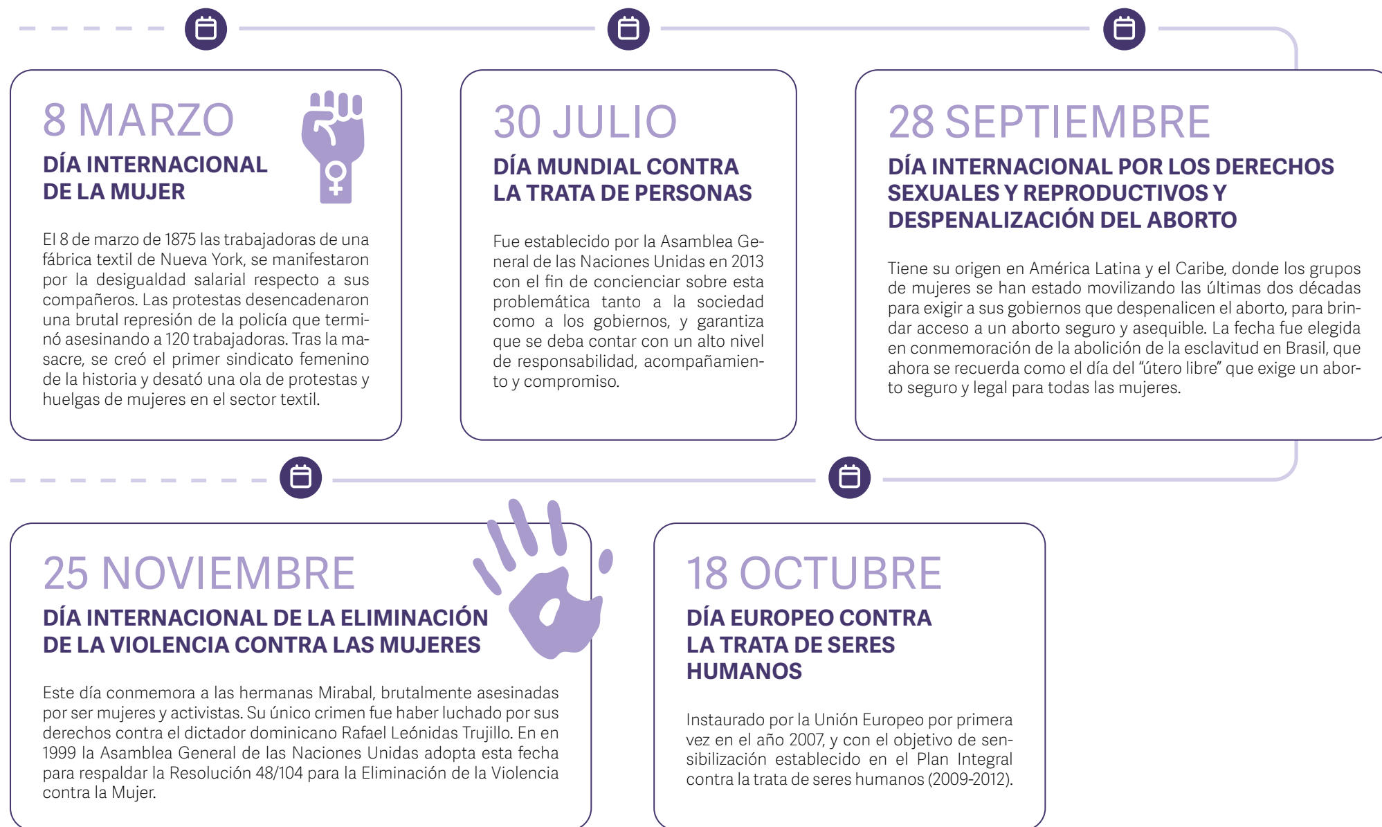
Figura 1. Fechas importantes en la lucha contra las violencias hacia las mujeres

Recomendaciones aplicables a los dos ámbitos